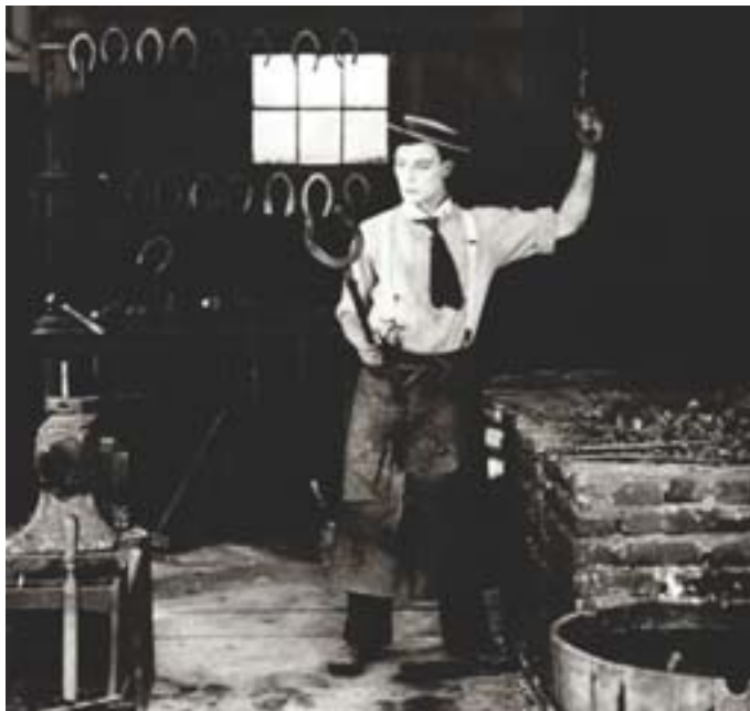
Musica dal vivo per 'The blacksmith' di Buster Keaton