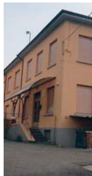
La scuola di Basaluzzo