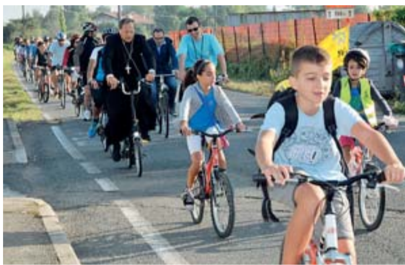
Anche il vescovo in bici al pellegrinaggio diocesano a Castellazzo