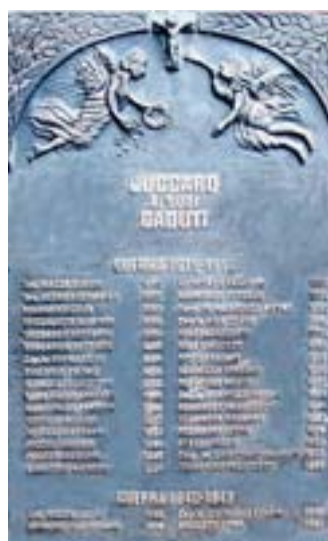
Ecco la nuova lapide, decorata da artistiche sculture, e con i nomi dei Caduti immortalati nel bronzo che verrà inaugurata a ottobre

di Biella). Secondo gli esperti, se vogliamo evitare assurdi trattamenti a ritmo mensile, le siepi di bosso, che da secoli adornano giardini e cimiteri, devono essere eliminate. Il che significa che, dinanzi a un Parco molto simile a un campo arato, l'iniziativa promossa dalle famiglie dei Caduti non è più un'opzione, ma una inderogabile necessità, che coinvolge tutta la comunità. In primis, le istituzioni».